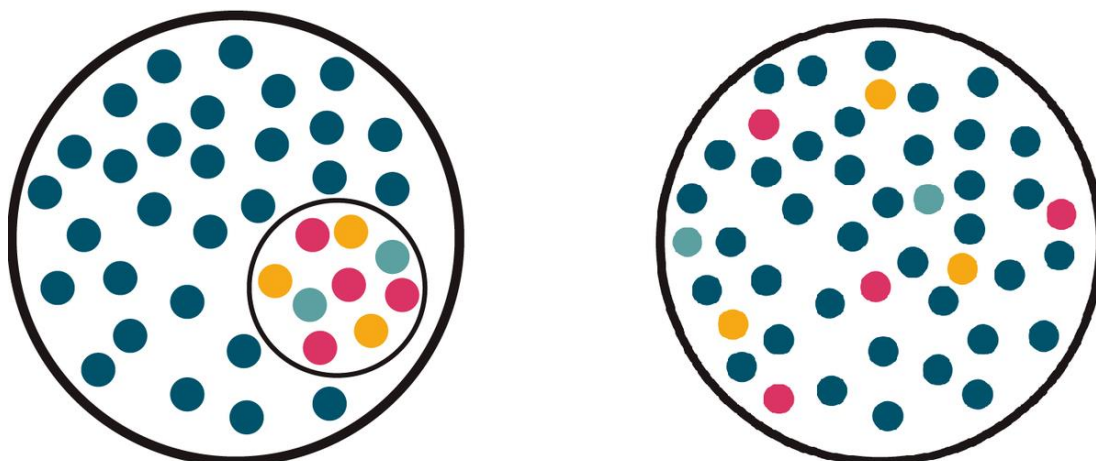
Intégration versus inclusion